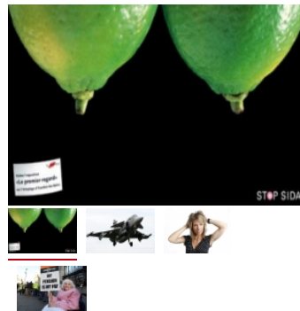
Illustration de la prévention contre le sida